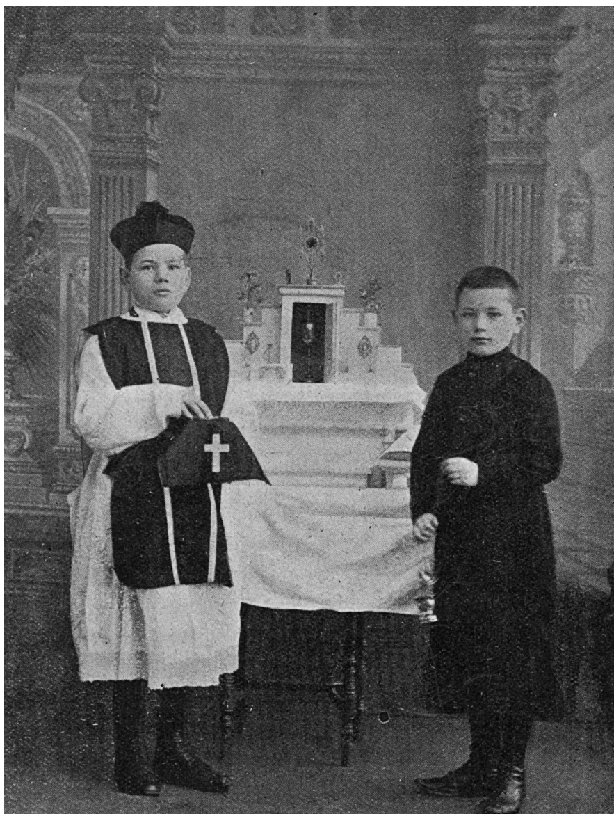
3. «Deux autres [enfants] jouant à la messe». Photographie publiée dans le mensuel néerlandais «De Engelbewaarder» («L'Ange gardien») en 1914 (Utrecht, Universiteitsbibliotheek, THO: TT 529 jr 1914/15 dl 30).

lors de fêtes annuelles déterminées, certains, revêtus de la mitre, portant la crosse et les vêtements pontificaux, et d'autres, habillés comme des rois et des chefs, bénissent à la manière des évêques. C'est ce que l'on appelle, dans certaines régions, "Fête des fous", "des Innocents" ou "des pueri ".