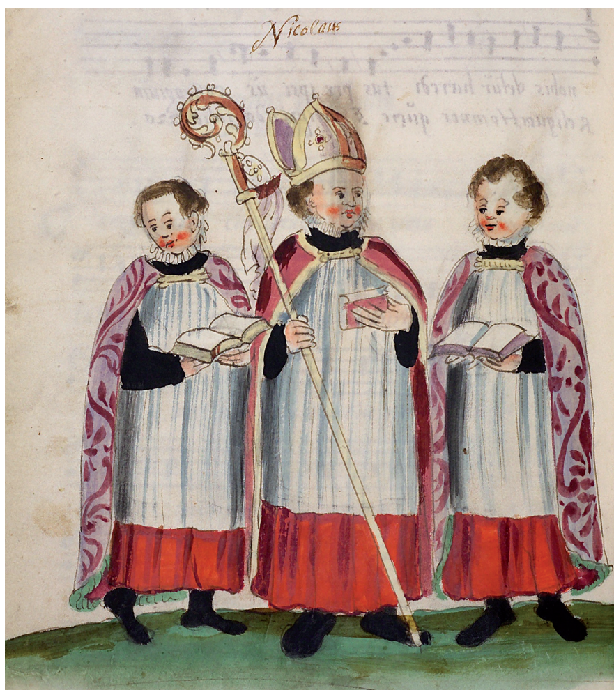
1. L'évêque des Innocents et ses deux ministres. Ordinaire de la collégiale St. Stephan de Bamberg, peu après 1582 (Bamberg, Staatsbibliothek, collection du Historischer Verein Bamberg, Hv. Msc. 476, c. 251v).

datent de la fin du XII e siècle. Dès le siècle suivant, il apparaît dans les archives d'un grand nombre de cathédrales, de quelques collégiales et paroissiales occidentales. Aux XIV e et XV e siècles, on le rencontre également dans plusieurs collèges et universités. Ce dignitaire, désigné chaque année pour remplacer le prélat en titre dans ses fonctions, est un écolier ( scolaris ) ou un puer , c'est-à-dire un clerc n'ayant pas encore été reçu aux ordres majeurs 6 . La crosse à la main, coiffé de la mitre, revêtu de la chape, il préside l'office des Saints-Innocents et, parfois, celui de son octave (4 janvier) depuis la chaire ou la stalle épiscopale.